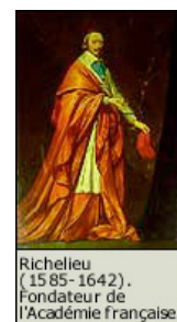
Richelieu (1585-1642). Fondateur de l'Académie française.

La seconde mission — le mécénat —, non prévue à l'origine, a été rendue possible par les