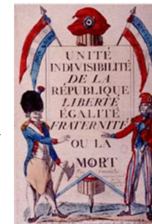
Unité, Indivisibilité de la République, Liberté, Egalité, Fraternité ou la mort Gravure coloriée éditée par Paul André Basset, prairial an IV (1796) © Photothèque des Musées de la Ville de Paris - Ph. Ladet

La devise est réinscrite sur le fronton des édifices publics à l'occasion de la célébration du 14 juillet 1880. Elle figure dans les constitutions de 1946 et 1958 et fait aujourd'hui partie intégrante de notre patrimoine national. On la trouve sur des objets de grande diffusion comme les pièces de monnaie ou les timbres.