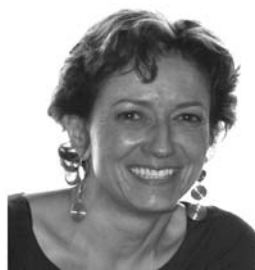
Née à Lyon, France résidente de Sonoma County depuis 1988.